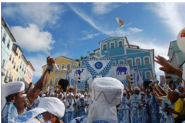
Filhos de Gandhi